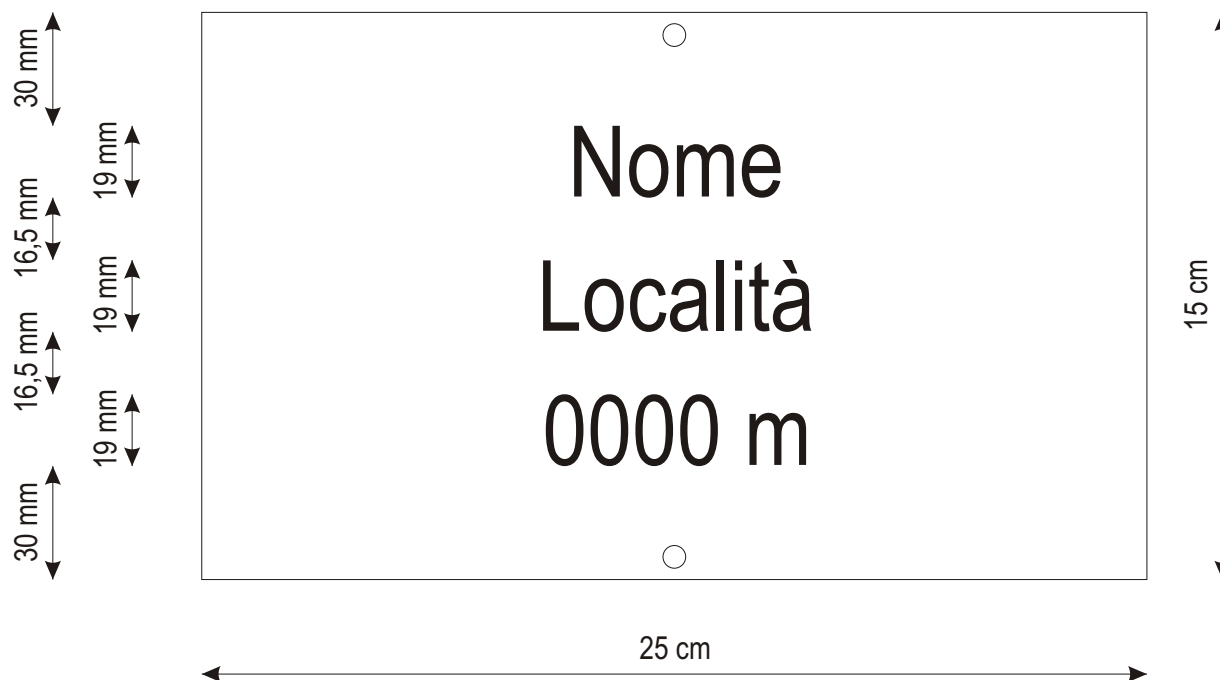
Fig. 3 Tabella di località